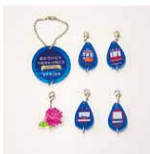
A: 車両正面 + あじさいピンク

【セット内容】ヘッド（全種共通デザイン）1個／車両チャーム 4個／あじさいチャーム 1個