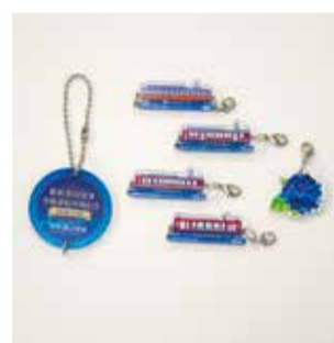
C: 車両側面（左右つなぎ）+ あじさい青