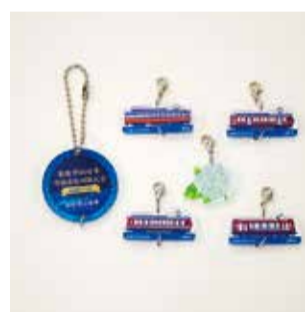
B: 車両側面（上下つなぎ）+ あじさい白