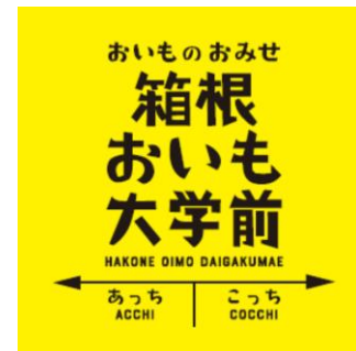
駅名看板型サイン ※イメージ