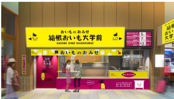
店舗外観 ※イメージ