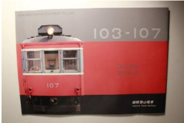
サンナナ車両カタログ 2,000円