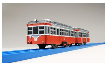
プラレール (モハ2形)