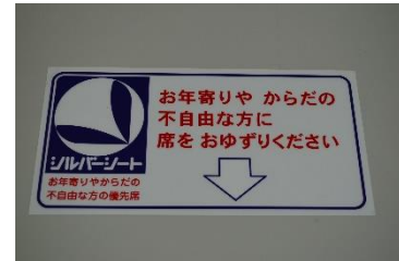
車内ステッカー 500円