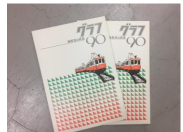
グラフ90 (冊子) 3,000円