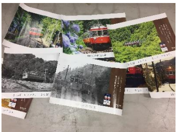
サンナナ中吊り (8枚セット) 3,000円