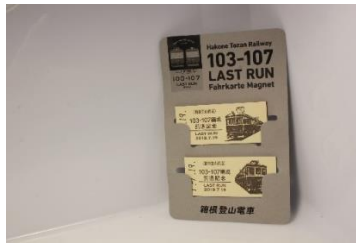
サンナナきっぷマグネット 500円