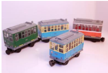
マグネット連結 (全6種) 500円