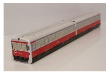
サンナナ車両型マグネット 500円