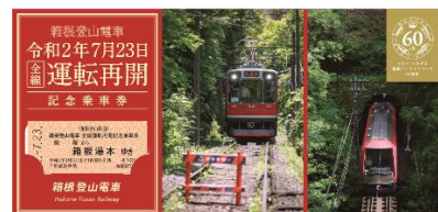
全線運転再開記念乗車券 (2枚セット)