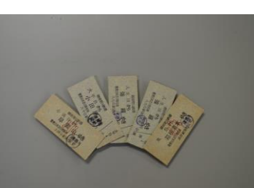
昔懐かしい硬券セット 100円