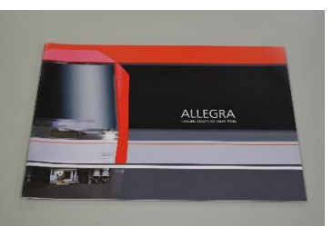
3000形パンフレット 2,000円