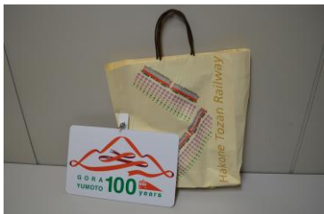
方向板各種 (紙袋付き) 30,000円~80,000円