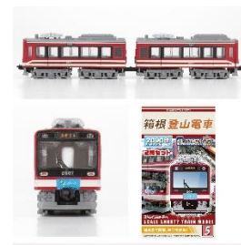
Bトレインショーティー