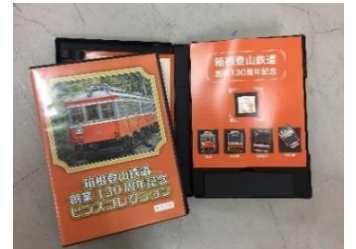
130周年ピンバッチセット 2,000円