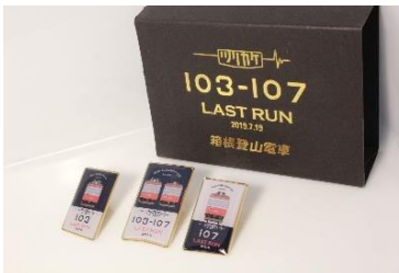
サンナナピンバッチセット 1,500円