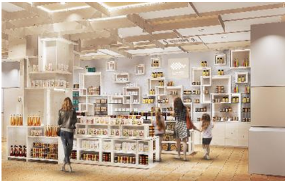
ショップ内観 (イメージ)