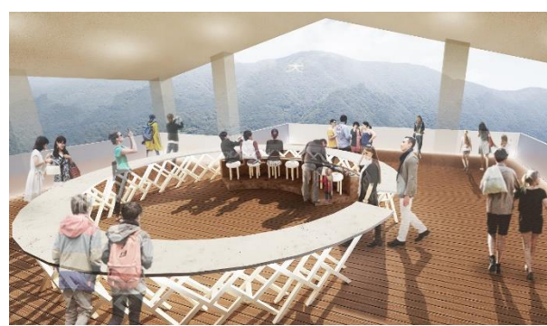
展望デッキ、足湯 (イメージ)