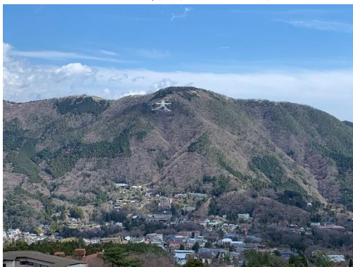
展望デッキからは、箱根外輪山を一望