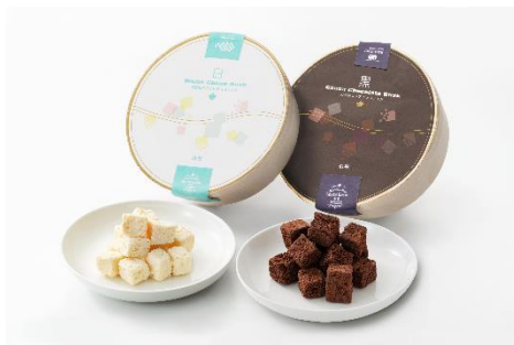
「早雲山ホワイトチョコラスク」「大涌谷ココアチョコラスク」